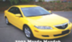
2003 Mazda Mazda6