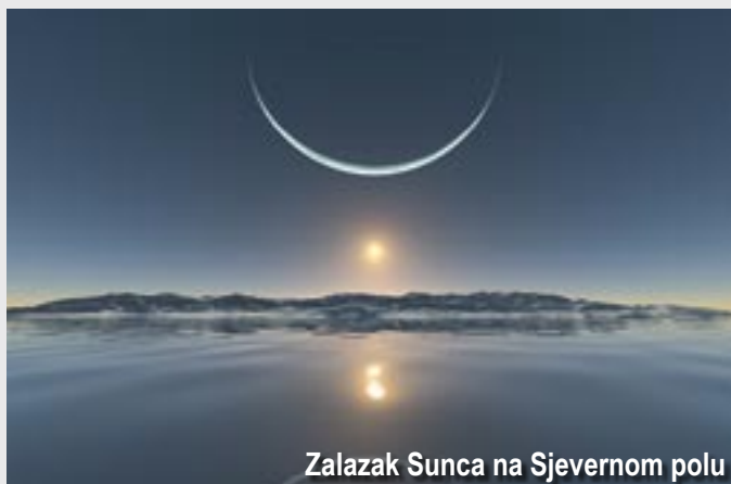
Zalazak Sunca na Sjevernom polu

Sjever je važan i u istorijskom razvoju ideje da je Zemlja prazna iznutra. Platon je držao da pod zemljom postoje gomile tunela i praznina, dok su naučnici poput Edmonda Halleya istražujući magnetna polja Zemlje došli do zaključka da postoji još jedna sfera ispod Zemljine kore koja ima svoje vlastito magnetno polje. Dok danas možemo reći da su takve ideje napuštene, istražujući ovu teoriju naučnici su došli do niza tačnih tvrdnji - slično kao što je i potraga za kamenom mudrosti dovela do važnih spoznaja na području hemije.