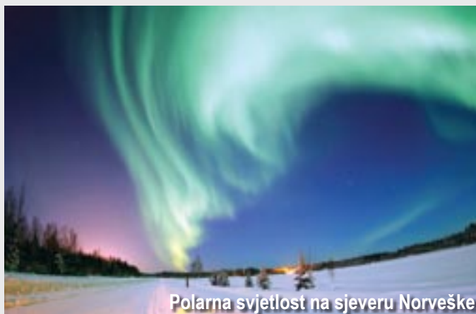
Polarna svjetlost na sjeveru Norveške

Marija Gavriilo, naučnica instituta za istraživanje Arktika i Antarktika tvrdi da se radi o nategnutim teorijama: magnetno polje na polovima jednostavno je jače nego na području bliže ekvatoru i u skladu s time jasno je da kompas postanu neupotrebljivi. Gavriilo je ustvrdila i da se magnetni polovi Zemlje mogu pomicati do neke mjere, a Aurora Polaris je posljedica promjena na atomskom nivou u višim slojevima atmosfere. Aurora Polaris je jak fenomen koji utječe na radio-valove i čak utječe na psihološko zdravlje ljudi. Civilizacije koje su živjele na krajnjem Sjeveru smatrale su ga zlim znakom. Gavrilin kolega, akademik Mark Sadikov, tvrdi da Zemlja ima više magnetskih polja koje mogu proizvesti i stare platforme - a što se tiče toplih vjetrova, ti vjetrovi mogu mijenjati svoju temperaturu ovisno o vremenskim uslovima.