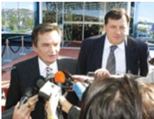
Haris Silajdžić i Milorad Dodik, ispred hotela Radon Plaza u Sarajevu, nakon potpisivanja protokola o reformi policije u BiH

- Protokol je neprihvatljiv je za SDA. Mi smo, čak uz Silajdžićevo blagonaklono klimanje, dan prije prihvatili Lajčakov protokol. Na Dodikovim i Silajdžićevim principima BiH ne može dobiti ni jedinstvenu, ni funkcionalnu policijsku strukturu, spremnu za uspješnu borbu protiv organizovanog kriminala, terorizma i ratnih zločina. Silajdžić, koji je kompletan politički imidž gradio na frazama o ukidanju RS i entitetsko-etničkog glasanja, napokon je dokazao da je to bila samo proračunata prevara kako bi dobio glaseve. Za Socijaldemokratsku partiju BiH (SDP BiH) neprihvatljiv je protokol o reformi policije koji su u petak potpisali lideri Stranke za BiH i SNSD-a, Haris Silajdžić i Milorad Dodik.