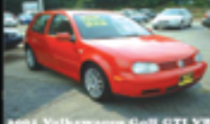
2003 Volkswagen Golf GTI V6