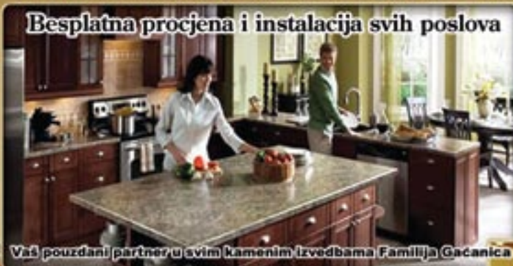
Vaš pouzdani partner u svim kamenim izvedbama Familija Gačanica

Besplatna procjena i instalacija svih poslova