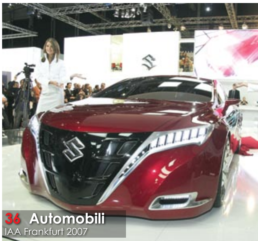
36 Automobili IAA Frankfurt 2007

Svim čitaocima islamske vjeroispovijesti želimo sretno i berićetne mubarek dane Ramazanskog Bajrama.