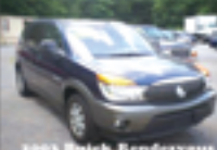
2003 Buick Rendezvous

American & European Car Dealer Sales and Repair