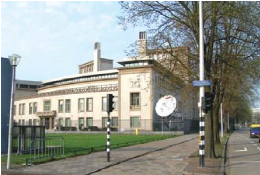
Zgrada Haškog tribunala

„U više slučajeva navedeni su konkretni primjeri ubistava nesrba koje su počinile identificirane jedinice (Prvog) krajiškog korpusa. I pazite, ovo govorim sasvim po strani od izvještaja u kojima se uopšteno govori o uništavanju imovine, iseljavanju seljana itd. Ima sasvim konkretnih primjera u koji-