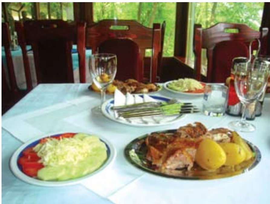
Teletina ili jagnjetina - meso s ražnja ide direktno na stol

Gledam jelovnik i primjećujem nešto što je tako tipično