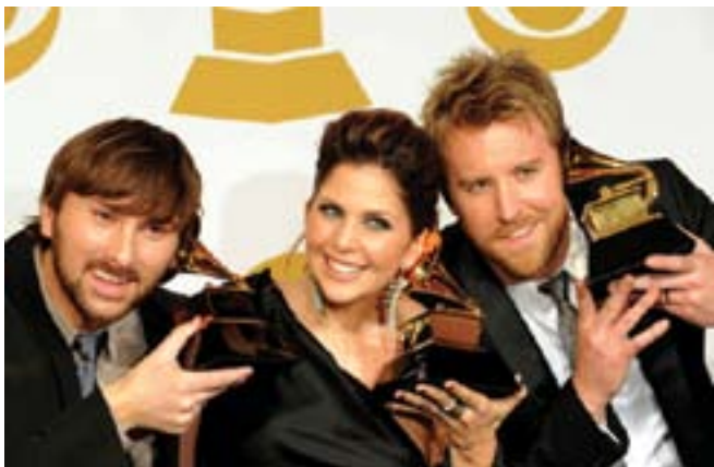
Country grupa Lady Antebellum

Zvijezda je ovogodišnje dodjele prestižnih nagrada Grammy country pop-trio Lady Antebellum. Od šest nominacija osvojili su pet nagrada, uključujući i one za pjesmu i singl godine Need You Now.