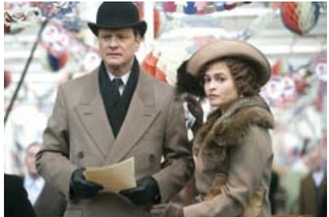
Scena iz filma „The King’s Speech“

„The Social Network“, film nominiran u čak sedam kategorija, kući dolazi s tri zlatna kipića, no niti jedan u glavnim kategorijama. Priča o Facebooku i njegovom začetniku Marku Zuckerbergu dobila je nagrade za najbolju muziku, najbolji prilagođeni scenarij te za najbolju montažu.