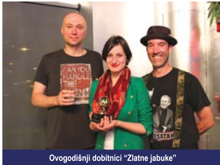
Ovogodišnji dobitnici "Zlatne jabuke"

Deveti godišnji Bosanskohercegovački Filmski Festival je također prikazao igrane filmove "Jasmina," "Circus Columbia," "U Zemlji Krvi i Meda," te dokumentarne filmove: "Film Mobitelom," "Svjedok," i "I Came to Testify."