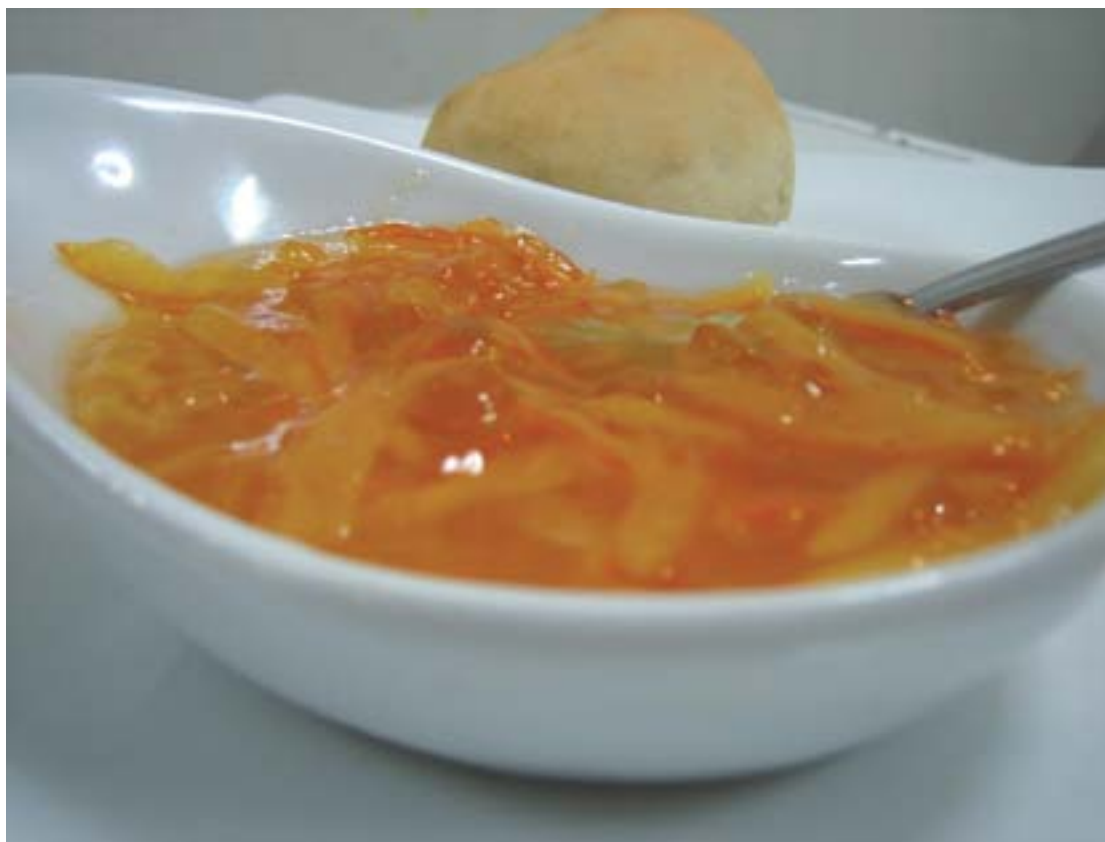
Slatko od narandži

sačuvati, trpeći neprestano na ovom tlu, orijentalne i srednjoevropske uticaje, za ovih 500 godina, koliko je baštine Sefardi?“ „Ako se posmatra u kontekstu 500 godina, može se reći da je kuhinja bosanskih Sefarda bila konzervirana, sve do unazad sto godina. Osjećao se blagi uticaj orijentalne i bosanske kuhinje, ali uticaje nekih drugih kuhinja tek počinje da prima sredinom 20. stoljeća. Najviše se to osjetilo kroz uvođenje nekih poslastica iz srednjoevropskih kuhinja, ali je jevrejska kuhinja u BiH i dalje ostajala karakteristična, jer se prenosila sa koljena na koljeno.“