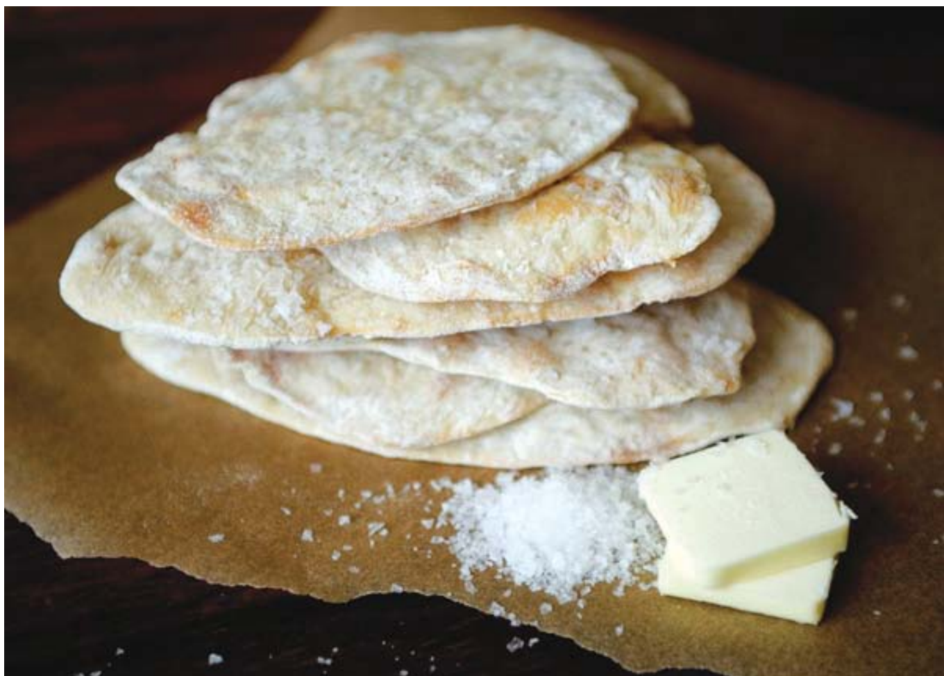
Čuveni beskvasni hljeb maces

„Koliko se tradicionalna jevrejska kuhinja u BiH uspjela