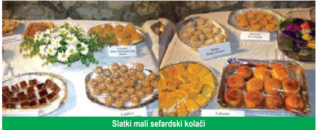
Slatki mali sefardski kolači