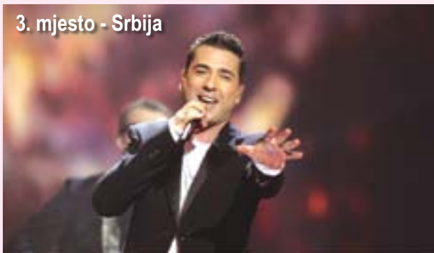
3. mjesto - Srbija

milionskog auditorija iz 42 zemlje, najbolja pjesma Evrope je "Euphoria", koju je izvela švedska predstavnica Loreen.