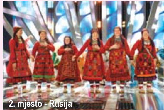
2. mjesto - Rusija

Nakon spektakularnog otvaranja finalne večeri i vatrometa u finalu Eurosonga na sceni Kristalne arene predstavili su se izvođači iz 26 zemalja: Rumunije, Moldavije, Islanda, Mađarske, Bosne i Hercegovine, Danske,