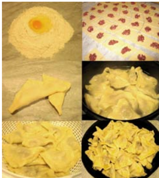
Klepe se pune mesnim nadjevom

Na putu od Sarajeva do Tuzle, ne možete a da ne prođete kroz Kladanj. I naravno, prva asocijacija na ovaj pitomi gradić u srcu BiH je, nekada čuvena 'muška voda' koja je mogla da preraste u opasan bh. brend - ali eto, nije. Nije zato što se ideja dopala mnogima, a kako se nisu mogli dogovoriti mnogobrojni 'skupljači kajmaka', stvar je propala, uostalom, kao i mnoge druge dobre stvari i ideje u BiH. Neko se, te davne 1968. godine prisjetio Evlije Čelebije, čuvenog turskog putopisca, koji je ovaj izvor nazvao 'izvorom mladosti'. Samo malo je trebalo, pa da izvor postane 'izvorom muškosti' i stvar je krenula. Pohrlili su mnogi, tih davnih godina prošlog vijeka, da na izvoru obnove svoju snagu, a malo poslije, voda je i flaširana. Sačuvana je, kao rijedak dokument, naljepnica koja je krasila flašu te čudesne vode, ali stid je prevladao, pa je skromno nazvana, tako flaširana, samo - kladanjskom vo-