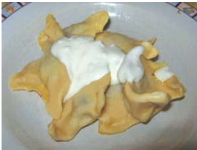
Klepe posute pavlakom

na njih stavljati nadjev od mesa. Klepe se mogu savijati u kvadratiće, trokutiće ili mašnice. U litar provrele vode, u koju se doda kašika ulja ili goveđeg masla, stavljaju se klepe i kuvaju oko 5 minuta. Kuvane su kada isplivaju na površinu. Ocijeđene klepe se preliju kajmakom ili pavlakom, i malo zapeku u rerni. „Mala opasnost dolazi od ovog kajmaka na kraju“, kažem. „Sve što ljudima u hrani ne odgovara, mogu da izbjegnju. Možda će klepe izgubiti nešto od pikantnosti, ako se ne preliju vrhnjem na kraju, ali može se i bez toga. Sve što sam starija, sve se zdravije hranim. Nema više nikakvog prženja u mojoj kuhinji“, kaže Minka.