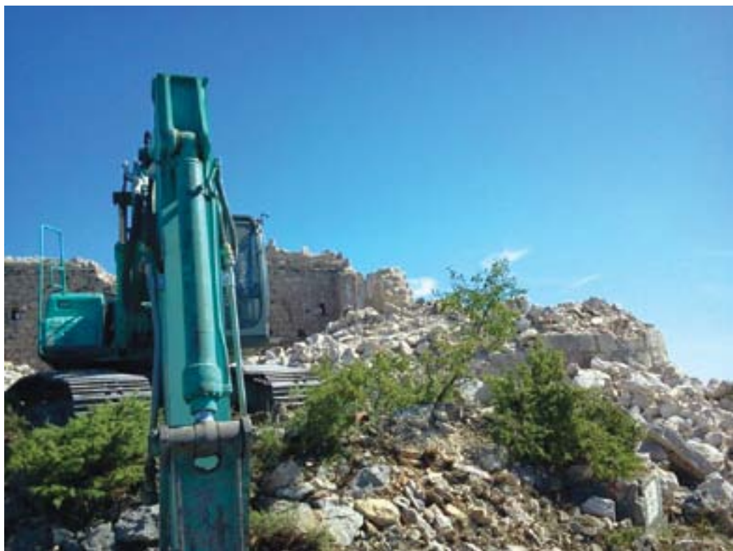
Bager na Petrini iznad Trebinja