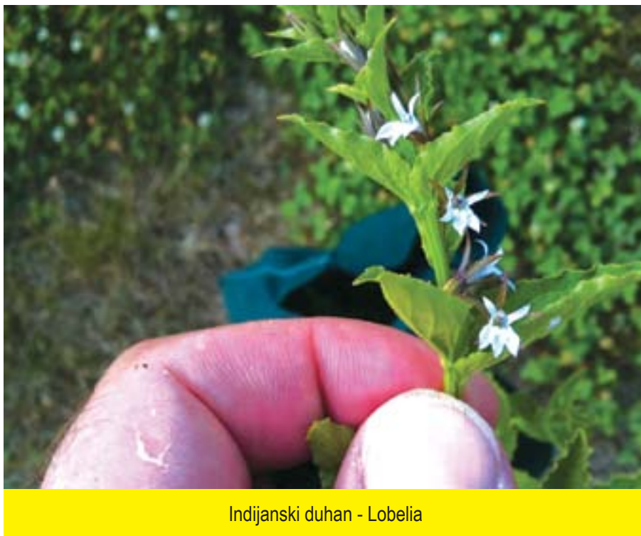
Indijanski duhan - Lobelia

Lobelia se smatra jednom od najjačih biljaka u svijetu tra-