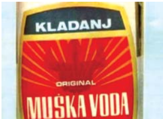
Naljepnica za flašu kladanjske muške vode

Ostajemo u njenoj kuhinji, jer će nam spremiti klepe, tradicionalno bh. jelo koje neodoljivo podsjeća na talijanske raviole i slatkiš koji će za mnoge, baš kao i za mene, biti pravo otkriće. „Sve je to iz nekadašnje sirotinjske kuhinje“, reći će Minka. „Jeste, ali tada smo bili sretni i nije nam bilo važno