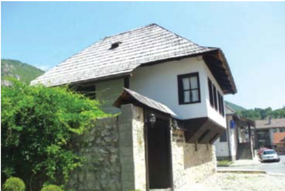
Rodna kuća nobelovca danas je muzej-restoran.