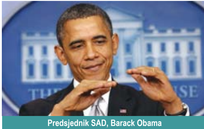
Predsjednik SAD, Barack Obama

Istovremeno, jedan od visokih zvaničnika Obamine administracije je istakao da lideri republikanaca ne bi trebalo da sprečavaju postizanje sporazuma.