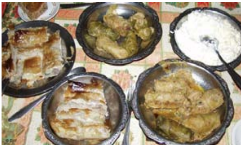
Bajramska trpeza kod Omera i Almase Hrvo

zatim puni smjesom mesa, krompira i luka. Peče se dok porumeni, a može se na kraju preliti uzavrelom mješavinom vode (1 dl.) i dvije supene kašike ulja. Bolji je topao, nego hladan“, kaže Almasa. Nakon baklave kod Kadrića, sjecani 'pitac' kod Hrva. I sve domaće i prvoklasno. Almasa je čak sve servirala u metalnim tanjirima koje je, kaže, dugo ribala, da opet zaiskre starim sjajem. Idem uzbrdo, prema vrhu Romanije, u selo Hotičina, da vidim kakva je bajramska trpeza u ovom malom, idiličnom selu, samo 5 km. udaljenom od Podviteza. Pored uskog, vijugavog, asfaltnog puta, na nadmorskoj visini preko 1000 metara, ugledam lovački dom „Srndać“. Čuje se pjesma, a unutra preko 30 duša koje gledaju samo u jednom pravcu: na ražnju, u povelikoj prostoriji, vrti se jagnje. „Pa, onda, kako ide to sa bajramskim slavljem?“ pitam dobrodržećeg čičicu. „Srbi smo“, kaže Danilo Kusmuk. „Ovo su penzioneri koji se povremeno okupljaju u ovom lovačkom domu i uz ražanj se malo zabave. Poslije će biti pjesme i plesa, kad se najedemo pečenja i malo popijemo“, kaže. Dakle, ražnjevi na sve strane. Zemlja propada, a narod se veseli.