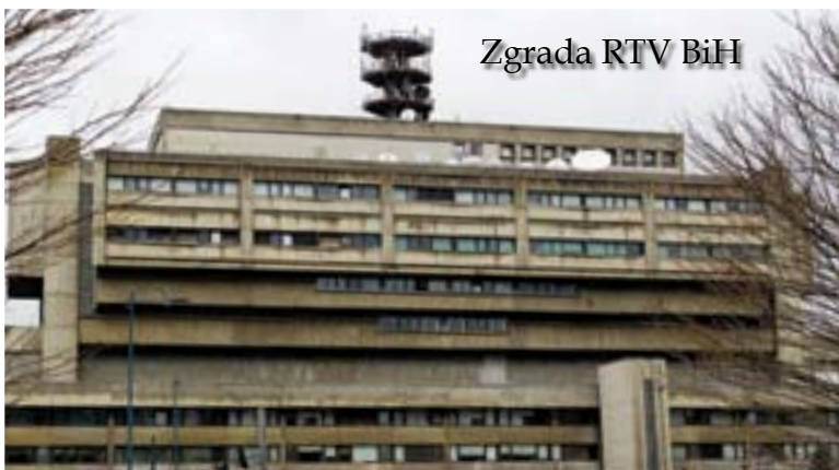
Zgrada RTV BiH

Godinama prije bosanskog rata devedesetih, pričavala se kao jedna od grubih i neumjesnih etničkih dosjetki, priča o čovjeku koji je nekim poslom iz okoline došao u Mostar i pitao prolaznika „gdje je ovdje općina?“ Odgovor – u tonu odbojnosti za hrvatski jezik – je glasio: „Najbliža općina ti je u Metkoviću“. Prošlo je od tada mnogo godina u kojima je u potrazi za novim identitetima sistematski produbljan jaz među narodima: crtanjem novih etničkih mapa, masovnim progonima i zlodjelima, rušenjem starih mostova i potcrtavanjem razlika, pored ostalog u jeziku, do otvorene netrpeljivosti za riječ „drugoga“.