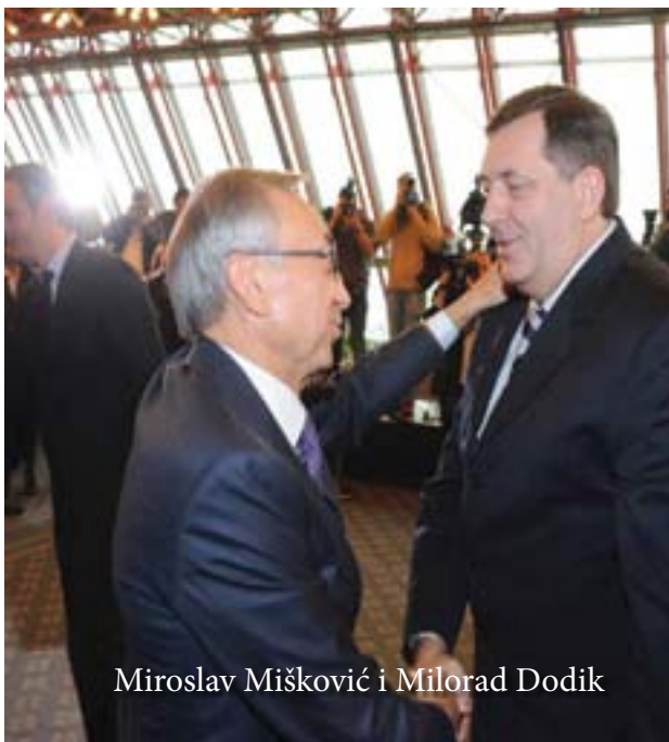
Miroslav Mišković i Milorad Dodik

maraka (oko 5,4 miliona eura). S druge strane i Dodikova kćer Gorica Dodik Trišić tada je upisala kako posjeduje preduzeće Trinity Media & Consulting u vrijednosti od 92 hiljade 874 konvertibilne marke, dakle negdje oko 46 hiljada eura. U četiri godine mandata na dužnosti premijera RS-a Dodik je svoju imovinu uvećao za kuću u Beogradu, koju procjenitelji procjenjuju i na oko pet miliona eura vrijednosti obzirom na lokaciju i vrijednost objekta, te za vrijednosti poduzeća koje glasi na Igora Dodika u visini od 1,3 miliona eura, kao i Igorovu tajnu ušteđevinu kod Hypo banke u vrijednosti od oko 5,4 miliona eura. Ukratko, Dodik je u četiri premijerske godine uspio zaraditi čak 11,7 miliona eura. Kada bi se tome pridodala vrijednost imovine njegove kćeri i supruge dobili bismo iznos od oko 11,8 miliona eura. Pritom, upravo iz njegove imovinske kartice vidimo da su njegovi legalni godišnji prihodi iznosili 59 hiljada 220,50 KM prihoda od premijerske plaće, 80 hiljada KM prihoda od poljoprivrede, te 100 hiljada KM prihoda od iznajmljivanja kuće u Beogradu. Prema tim podacima koje je u svojoj imovinskoj kartici upisao sam Dodik,