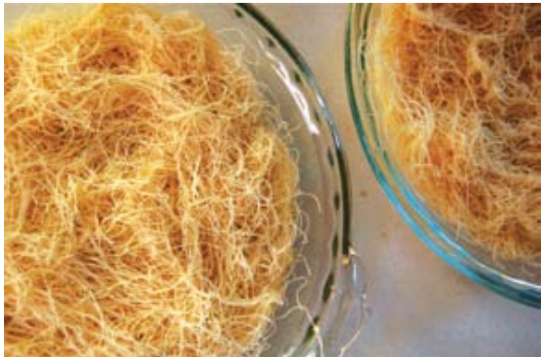
Na polovicu kadaifa stavlja se puter i groždice