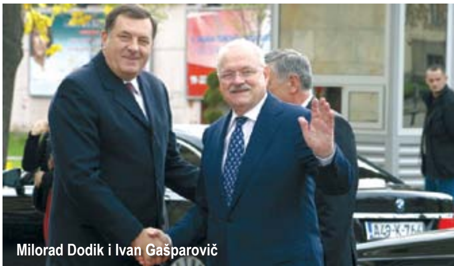
Milorad Dodik i Ivan Gašparovič

Evropske Unije u proljeće 2004. kad je primljeno deset novih članica, uključujući i Slovačku. Tada sam organizovao sastanak s ambasadorima novoprimitljenih država u pripremama za konferenciju za štampu o tome kako proširenje Unije istovremeno proširuje i granice stabilnosti i vladavine prava u Evropi. Iako je dokument koji smo tada ponudili evropskoj štampi – sa statistikom o putevima droge i organizovanog kriminala – nosio taj pozitivni ton očekivanja da proširenje jača, a nikako ne slabi, vladavinu prava u Evropi, ambasadori novoprimitljenih članica nisu prihvatili podjelu na „stare“ i „nove“ članice Unije jer su njihove zemlje u procesu ispunjavanja uslova za članstvo već dokazale prihvatanje i sposobnost provođenja