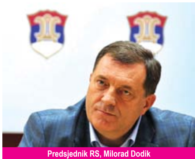
Predsjednik RS, Milorad Dodik

Dvadeset šest godina ranije Srpska akademija nauka i umjetnosti (SANU) sastavila je memorandum koji je, također, u septembru, ali 1986. objavljen u Večernjim novostima, tada visokotiražnom dnevnom listu. Memorandum je izazvao burne reakcije i suprotstavljena gledanja, uskovitlao srpsku naci-