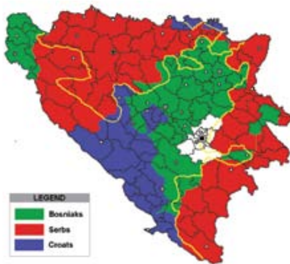
Owen-Stoltenbergov plan iz 1993.

Razumijevajući ovu odredbu otpada svaki prigovor iz manjeg entiteta u pogledu proširivanja nadležnosti države BiH ili pak pokušaja da se prenesene nadležnosti ponovo vrate entitetima. U Dodikovom dokumentu spomenuta odredba je vrlo redukcionistički tumačena i svodi se samo na prvu od četiri situacije, a to je – ako se entiteti dogovore. Međutim ovom odredbom je slovom Dejtona rečeno da BiH pripadaju i sva ona pitanja koja su potrebna da se očuva suverenitet, teritorijalni integritet, politička nezavisnost i međunarodni subjektivitet Bosne i Hercegovine, a takvih pitanja je jako mnogo i samo kad bi se ovaj dio odredbe o dodatnim nadležnostima u potpunosti primijenio Bosna i Hercegovina bi se mnogo više približila svojoj pravnoj prirodi kao unitarna visoko decentralizirana država.