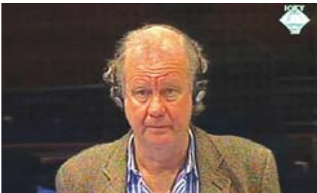
Ed Vulliamy, britanski novinar

Haško suđenje bivšem lideru bosanskih Srba Radovanu Karadžiću nastavljeno je svjedočenjem Eda Vulliamyja koji je početkom avgusta 1992. godine bio u grupi novinara pri obilasku logora na području Prijedora.