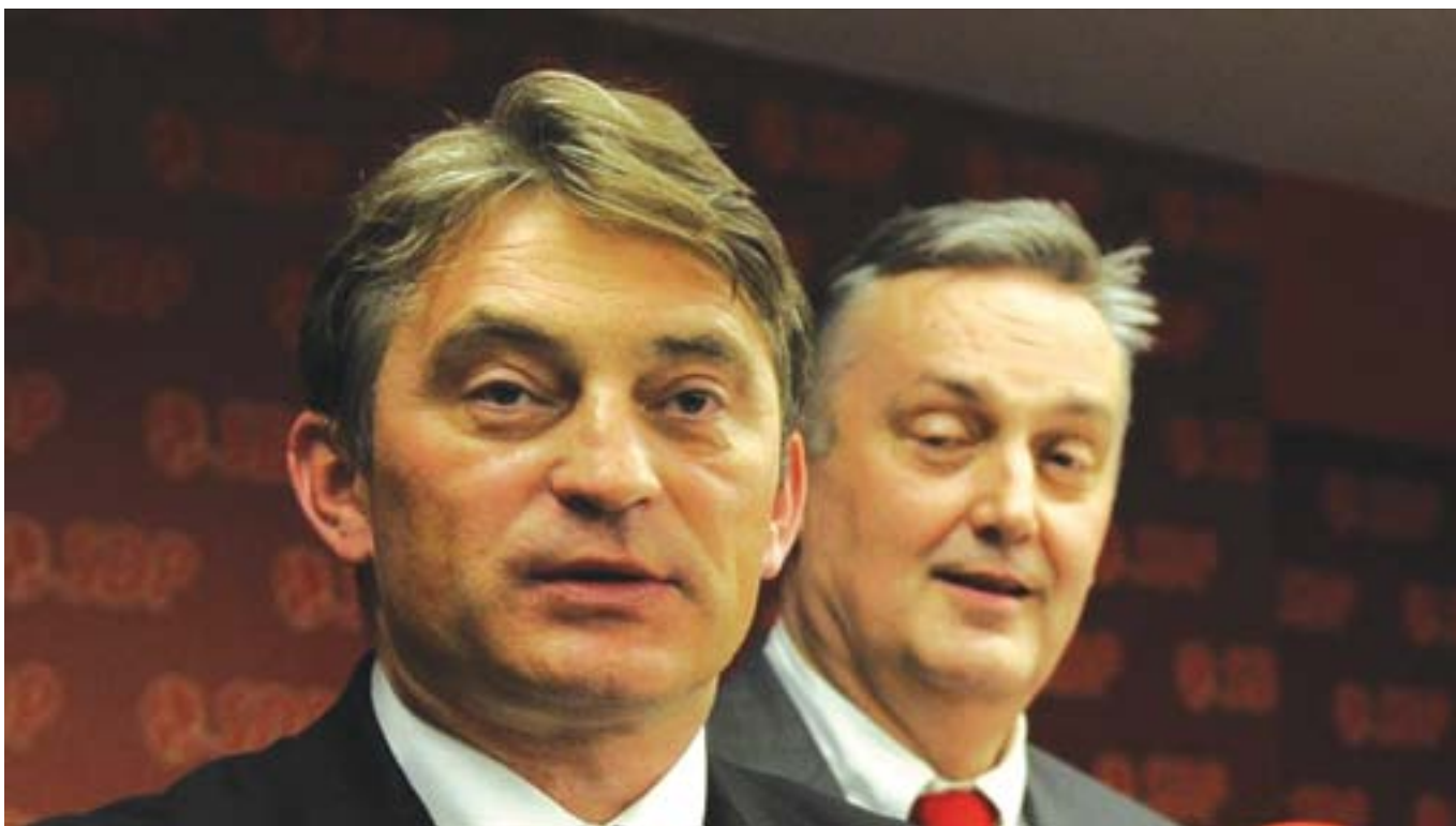
Željko Komšić i Zlatko Lagumdžija

Za razliku od prve epizode u martu ove godine, kada je Komšić, nakon dramatičnih reakcija u javnosti i vanredne sjednice Predsjedništva SDP-a BiH, povukao ostavku na stranačke funkcije, i Komšić i njegovi stranački drugovi su sada reagovali drugačije.