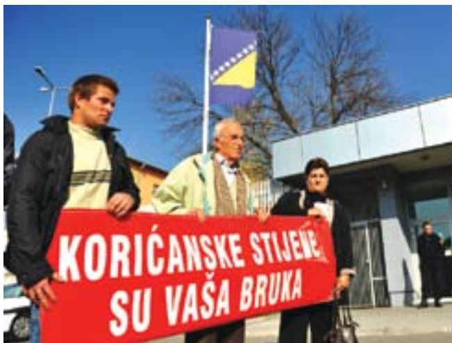
Protest zbog ukidanja presude za zločin na Korićanskim stijenama u Sudu BiH, Sarajevo, 2.11.2011.